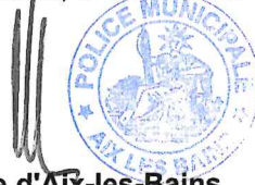
Le Maire d'Aix-les-Bains Renaud BERETTI